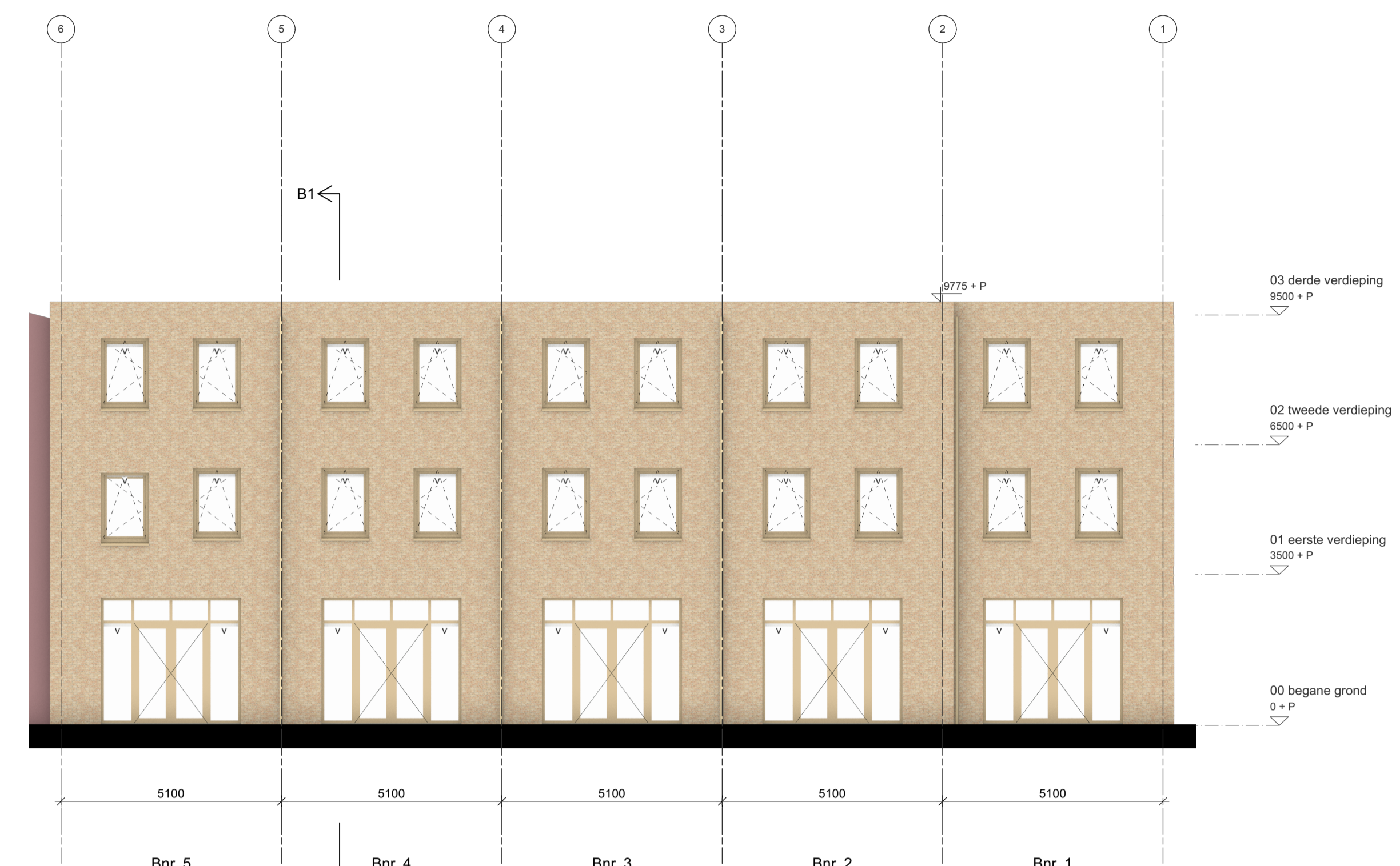
Achtergevel Bnr. 1 t/m 5