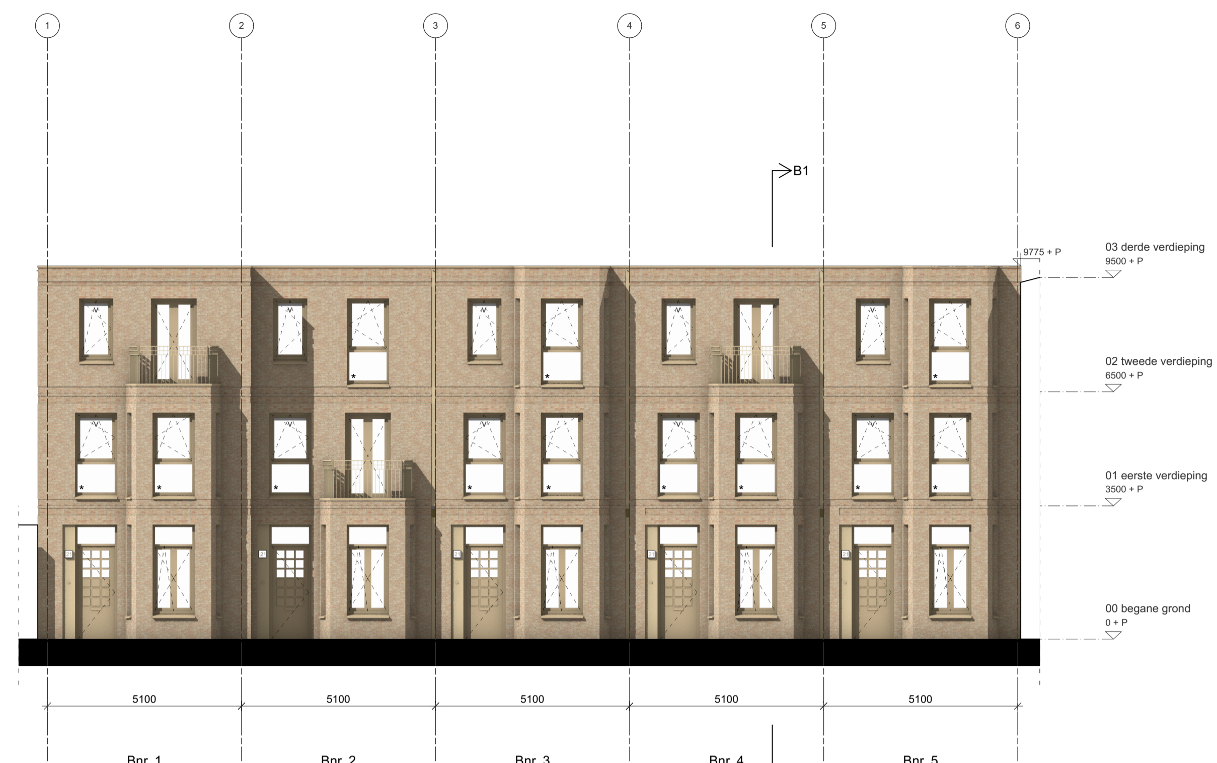
Voorgevel Bnr. 1 t/m 5