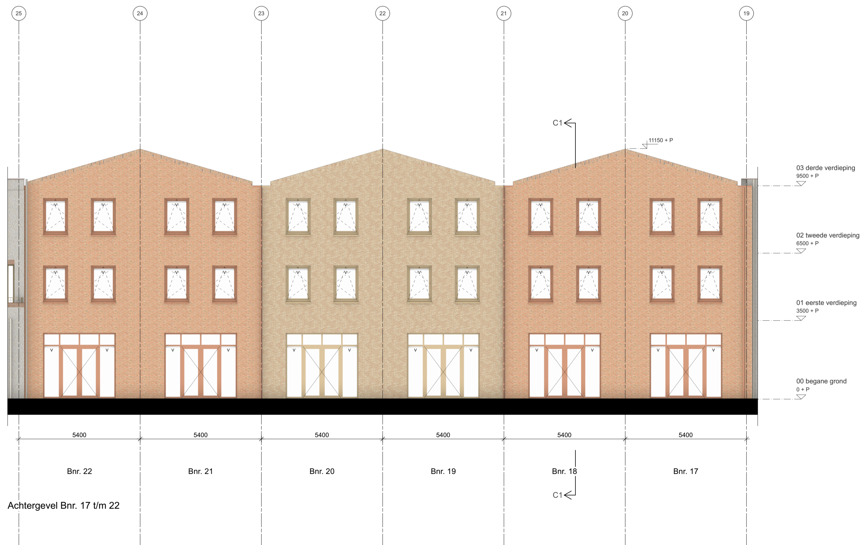
Achtergevel Bnr. 17 t/m 22