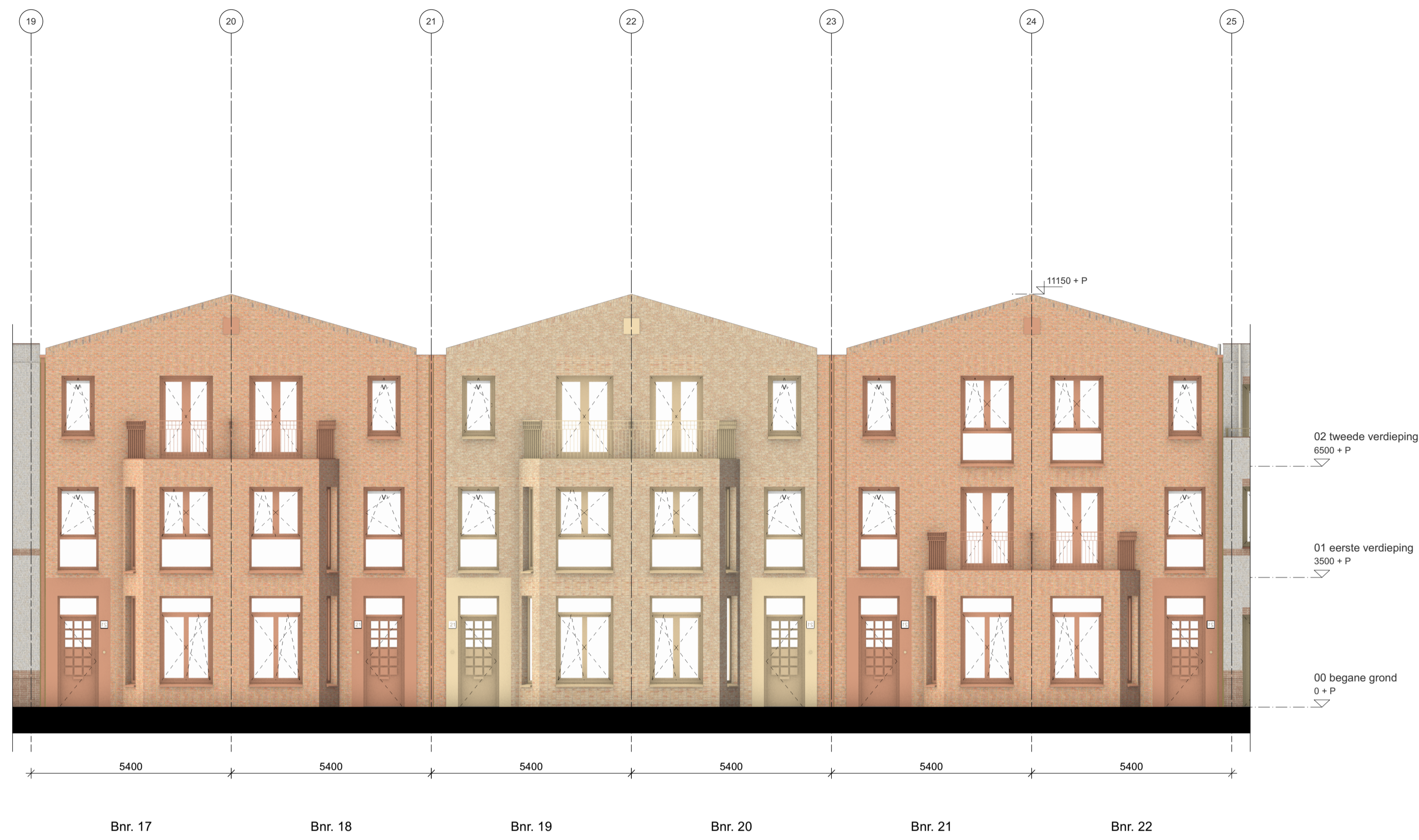
Voorgevel Bnr. 17 t/m 22