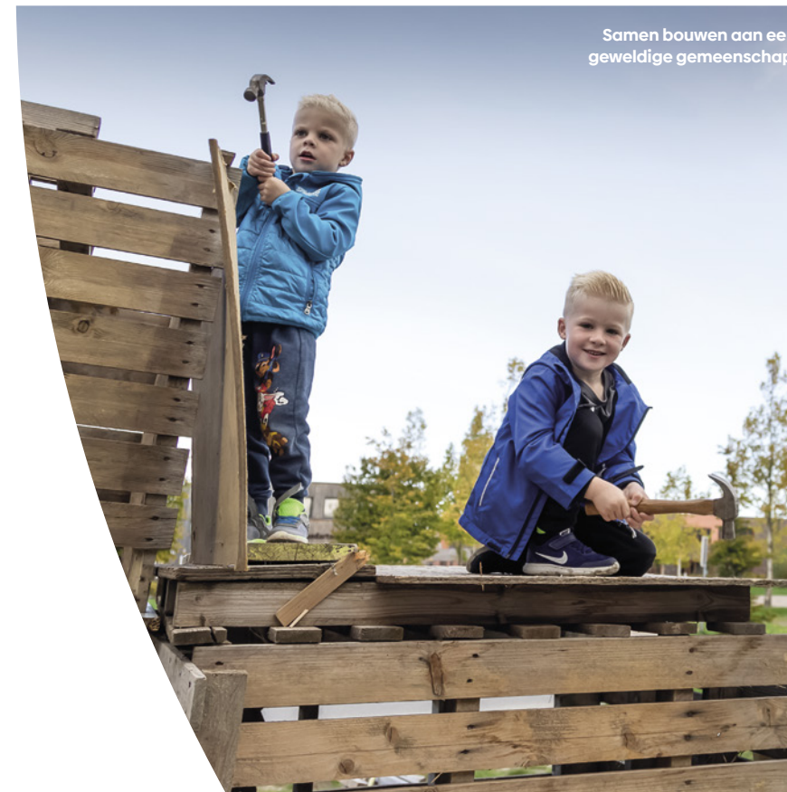
Samen bouwen aan een geweldige gemeenschap.

Je hoeft niet ver te reizen voor essentiële diensten. Enkele woningen worden gebouwd als woonwerk-woning. Hier vestigen zich kleine bedrijven die de buurt van dienst zijn, denk bijvoorbeeld aan een kapper of een fysiotherapeut. Zij dragen bij aan het