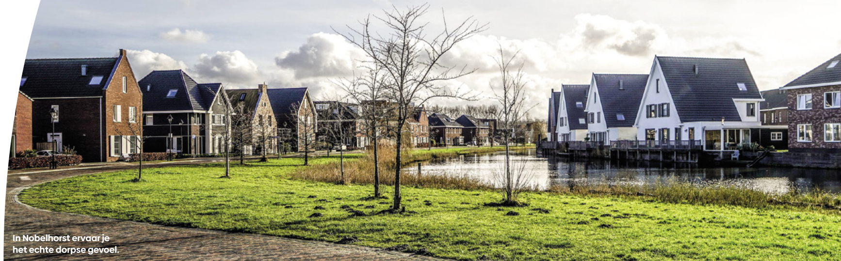
In Nobelhorst ervaar je het echte dorpse gevoel.

Binnen Het Marktdorp liggen 3 buurten, met elk een eigen karakter: Het Dorpshart, De Eilanden en Aan Het Bos. Verspreid over deze 3 buurten worden 60 duurzame woningen gebouwd onder bijzondere – natuurinclusieve – architectuur.