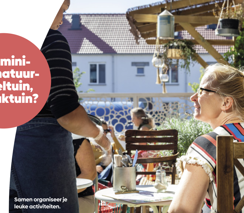
Samen organiseer je leuke activiteiten.

Een mini- bos, natuur- speeltuin, of pluktuin?