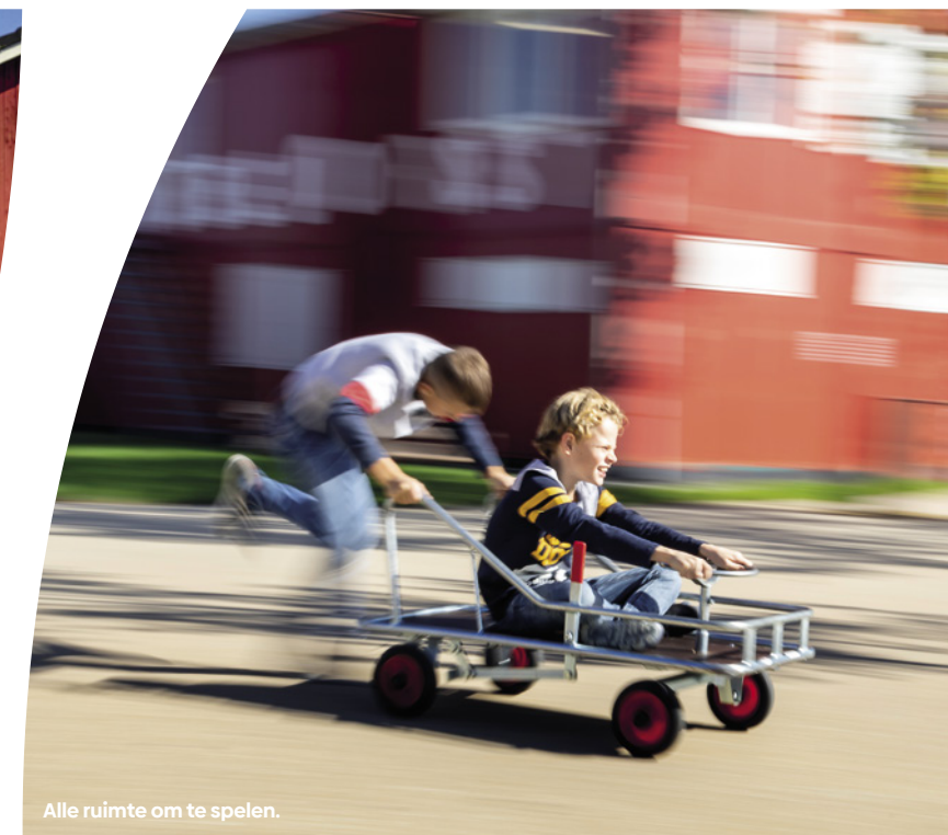
Alle ruimte om te spelen.