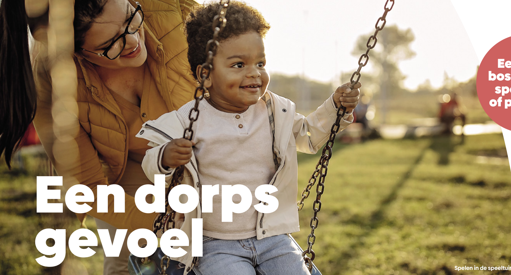
Spelen in de speeltuin.

Het echte dorpsgevoel – elkaar begroeten in het voorbijgaan, een kopje suiker lenen bij de burens, kinderen die spelen op straat – creëer je samen. Het onderlinge vertrouwen groeit, elke keer dat je elkaar spreekt en wanneer je iets samen doet. In Groen Nobelhorst krijg je hier, heel ontspannen, alle gelegenheid toe. Doe mee en maak deel uit van deze prachtige, hechte en unieke gemeenschap.