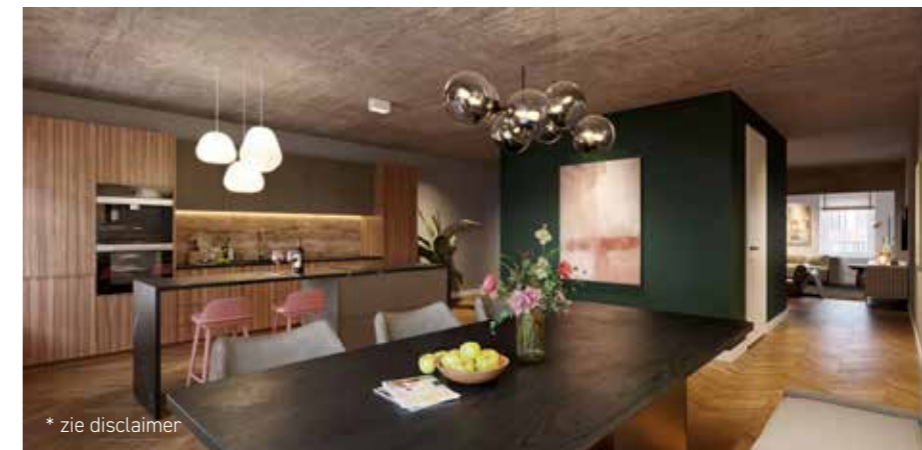
* zie disclaimer