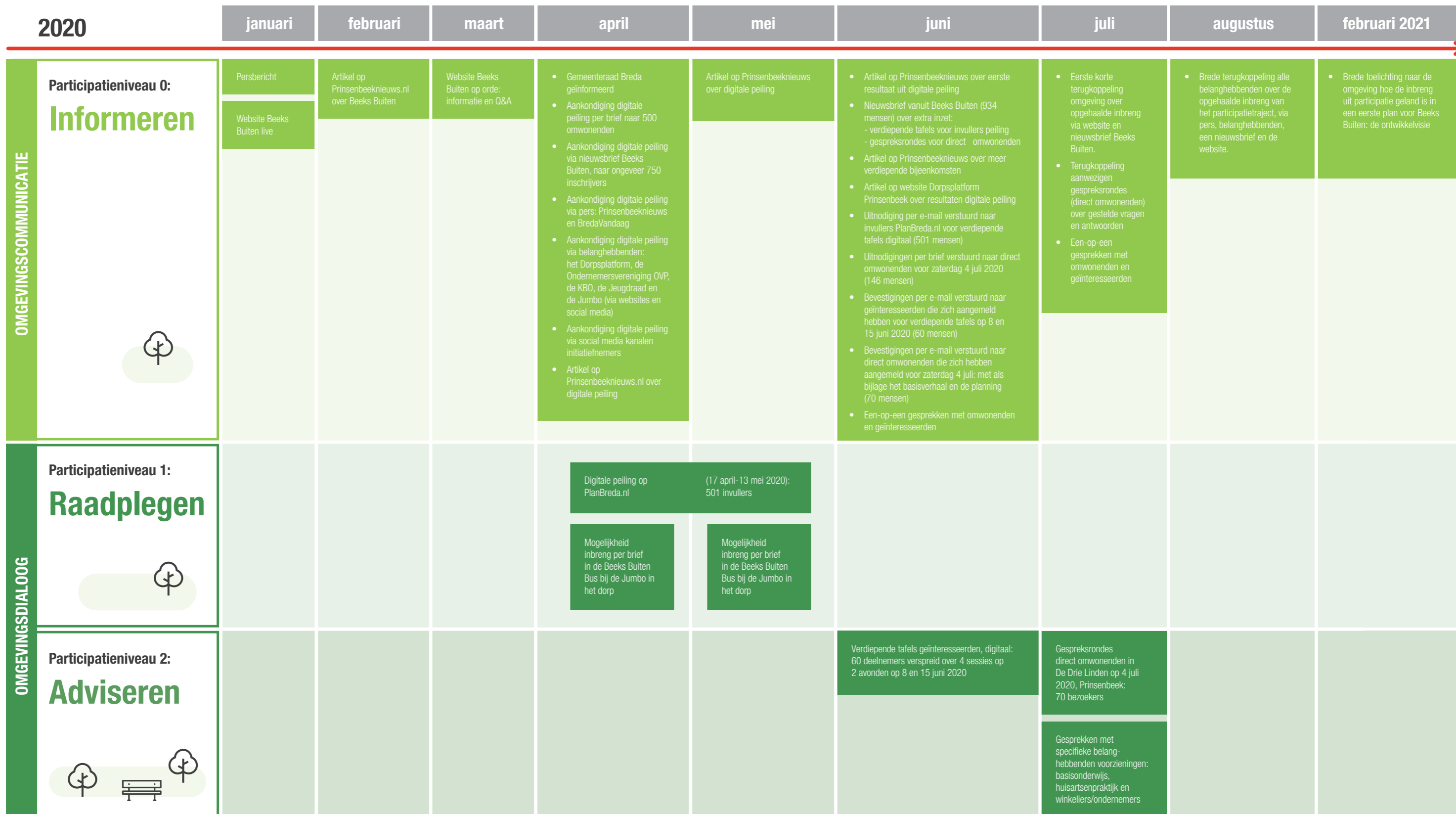
Figuur 2: communicatie- en participatieactiviteiten

Alle activiteiten die we in de drie participatieniveaus hebben ingezet, zijn inzichtelijk gemaakt in onderstaand schema.